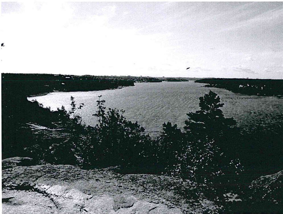
Utsikt över Edsviken från Falkberget

2017-02-23 (reviderad efter årsmötet med avseende på inkomna synpunkter)