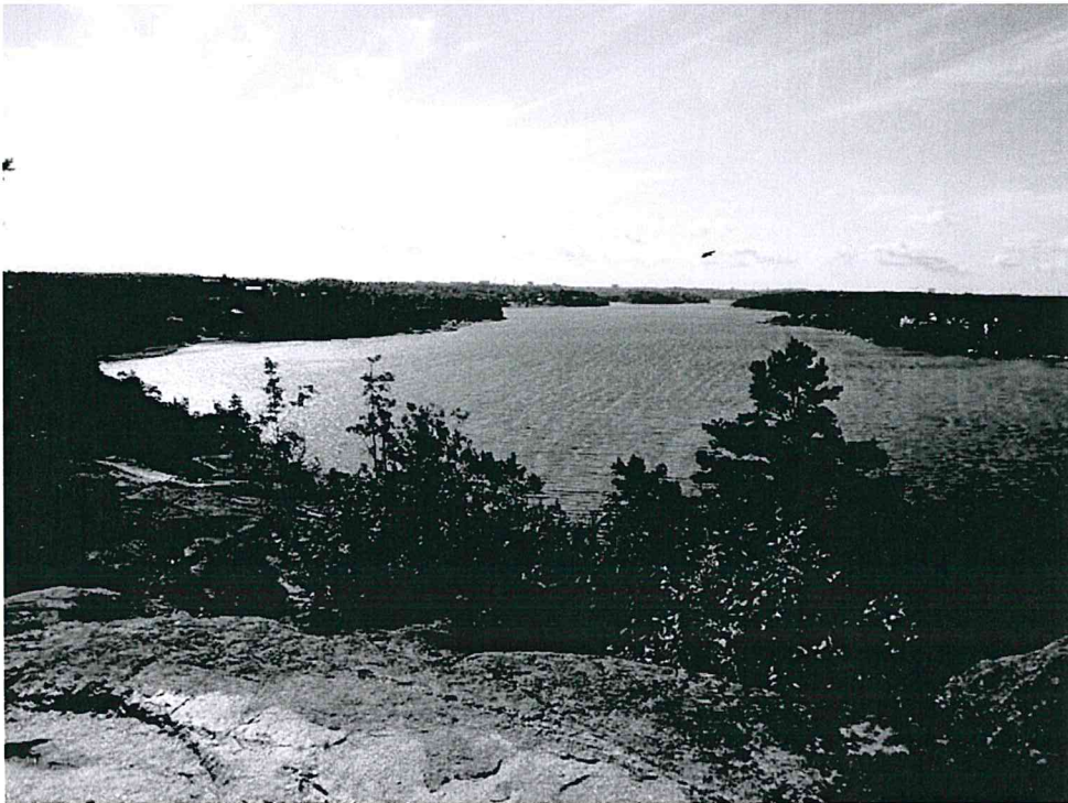
Utsikt över Edsviken från Falkberget