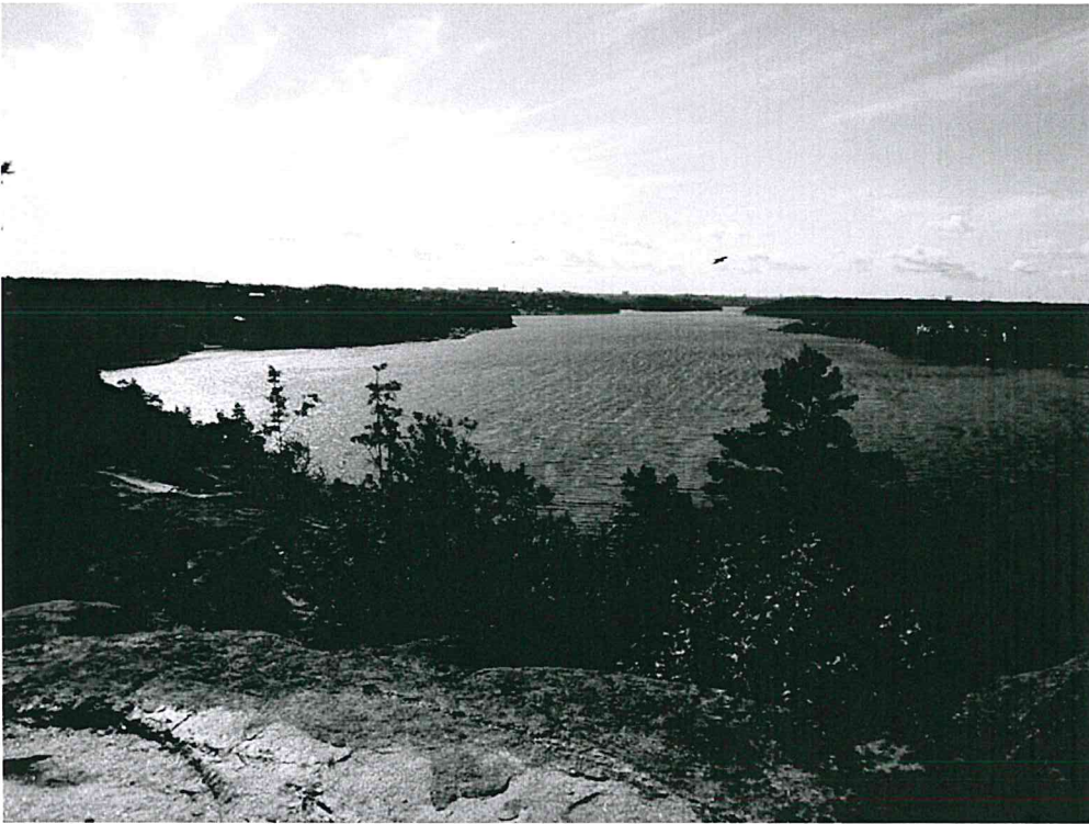
Utsikt över Edsviken från Falkberget

2017-02-23 (reviderad efter årsmötet med avseende på inkomna synpunkter) 2017-12-06 (reviderad inför 2018)